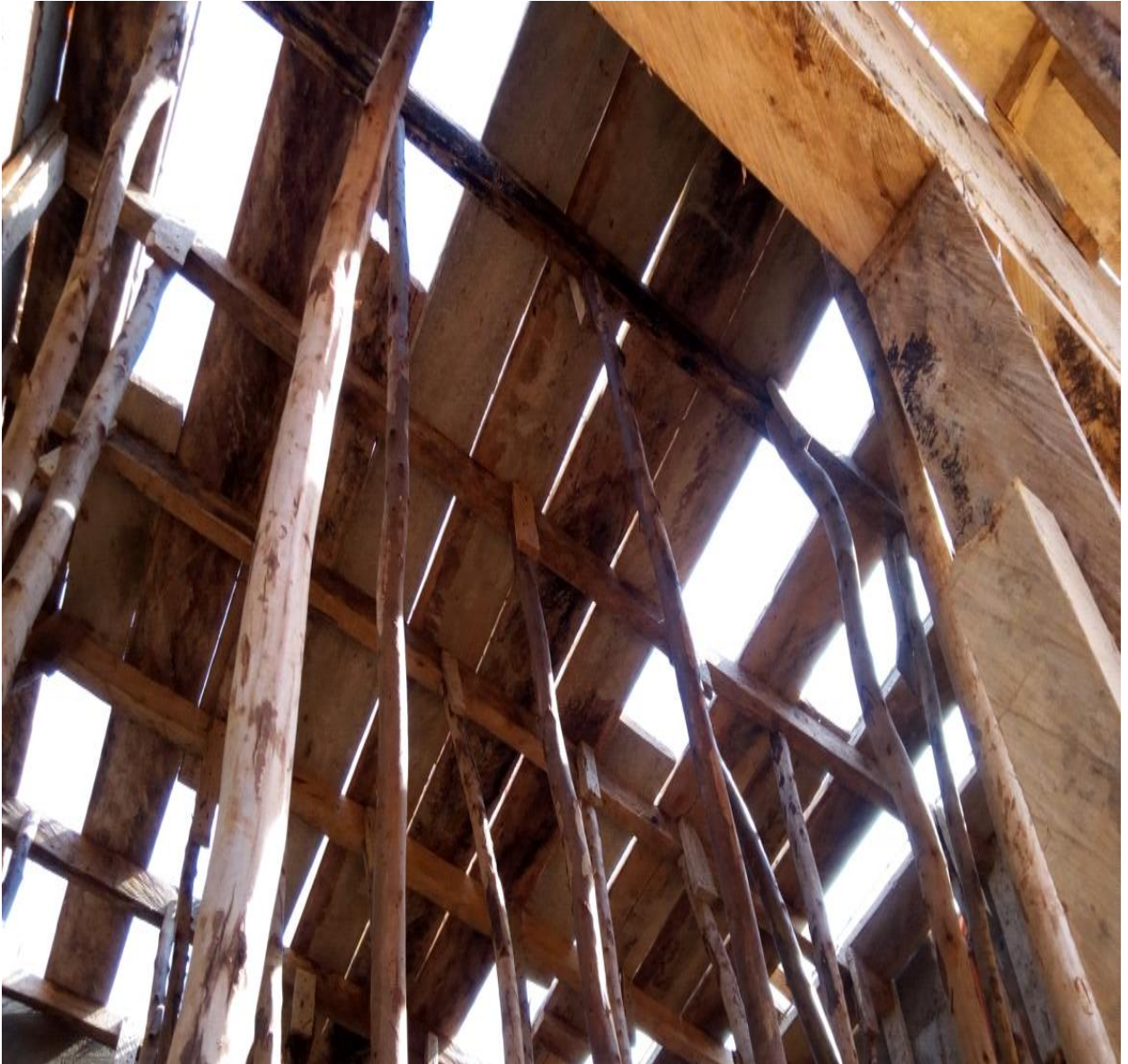
Figure 24 : Pose des étais