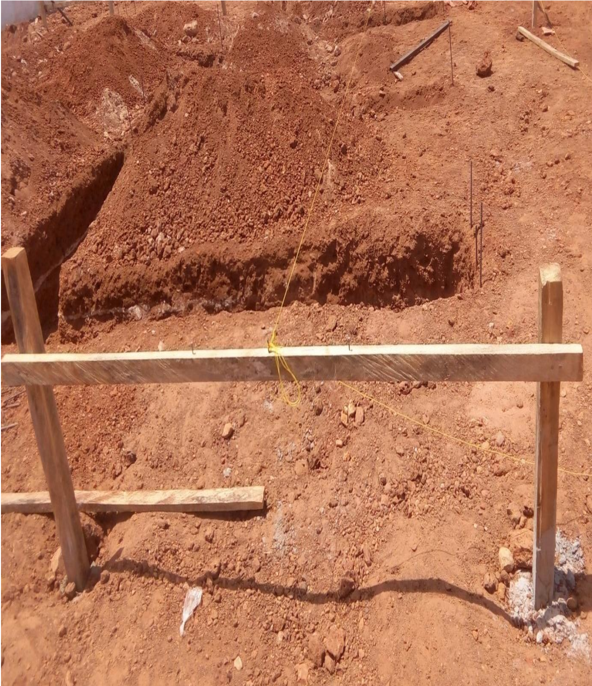
Figure 9 : Implantation