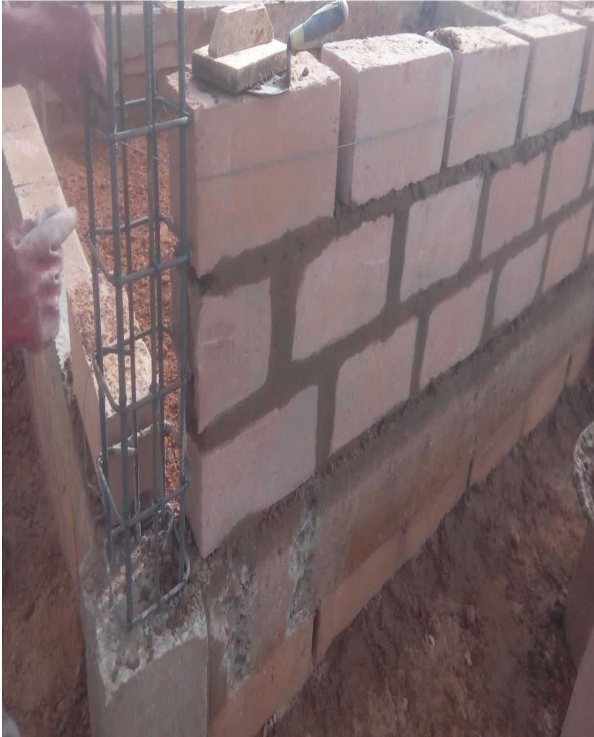
Figure 20: Maçonnerie