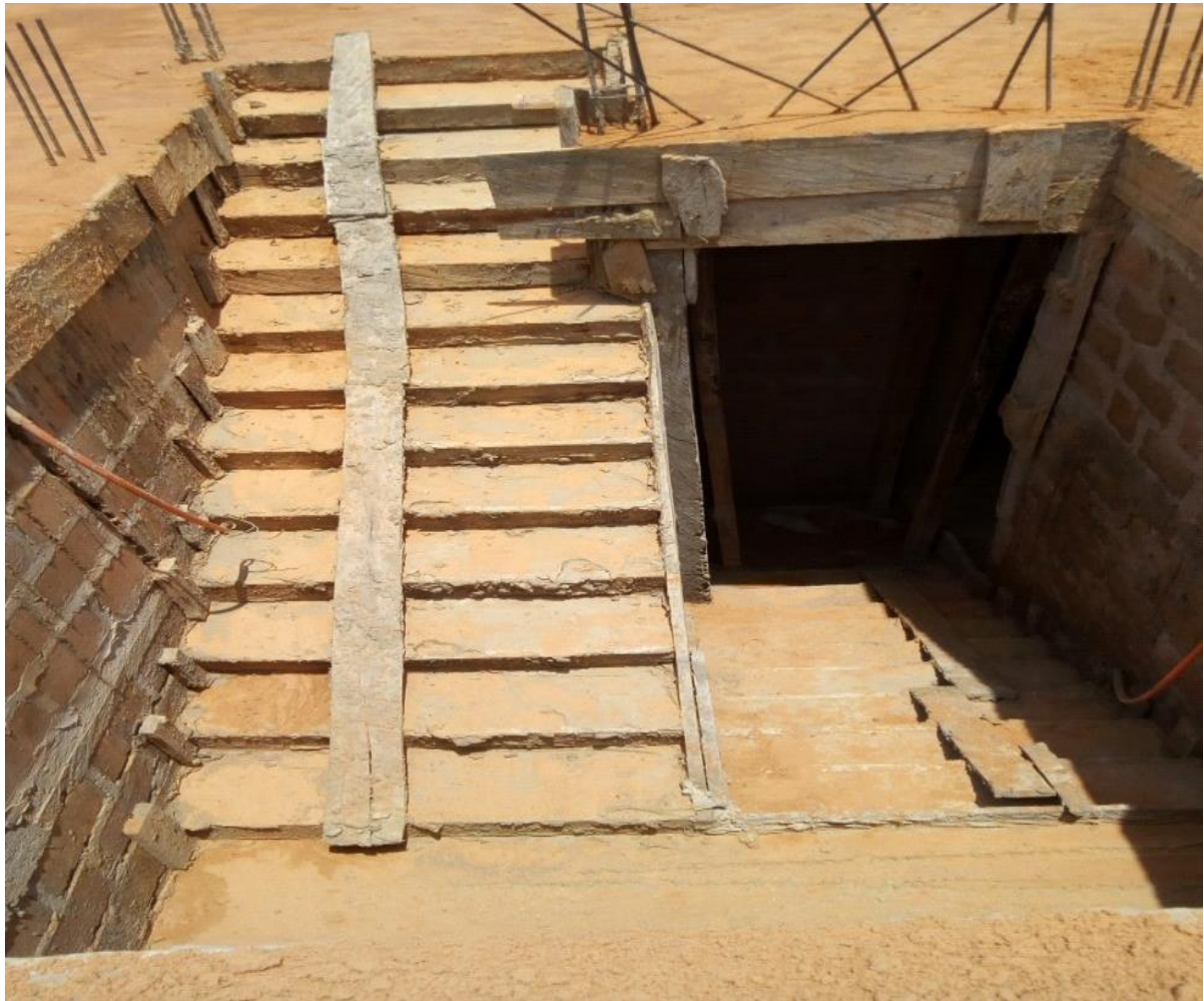
Figure 34 : L'escalier