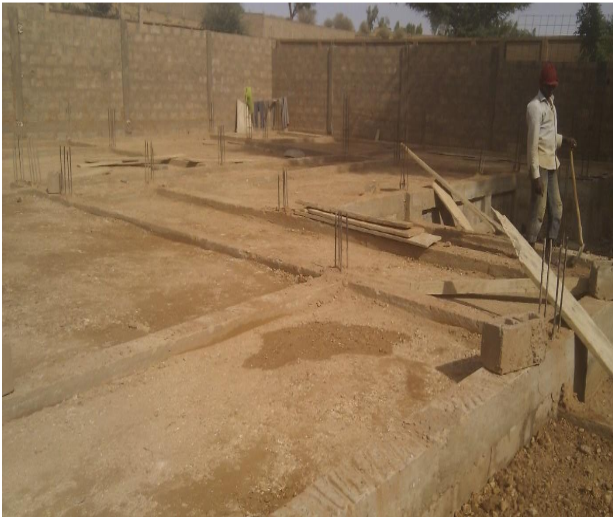
Figure 11: Exécution du Remblai arrosé et compacté pour forme d'aire

Après les remblais de La forme d'aire, un béton fort de 10 cm d'épaisseur dosé à 350\text{kg/m}^3 est réalisé sur l'ensemble des surfaces des pièces, et des terrasses. Son niveau est calé à la cote supérieure du chainage bas à l'intérieur des pièces. Les terres excédentaires sont arrosées et compactées avec des dames manuelles. Si elles ne couvrent pas l'épaisseur du remblai ; elles sont complétées par des terres d'emprunts arrosées et compactées en couches successives d'environ 20 à 30 cm, jusqu'à atteindre l'épaisseur totale du remblai.