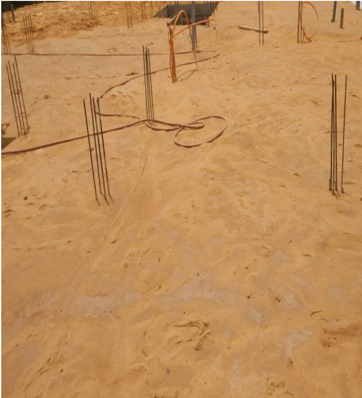
Figure 30: Cure du béton

La cure du béton est la protection apportée pour éviter sa dessiccation et lui assurer une maturation satisfaisante. Sur le chantier la technique utilisée pour la cure du béton est l'étalage du sable mou et humidifié de manière régulière sur toute la surface du plancher.