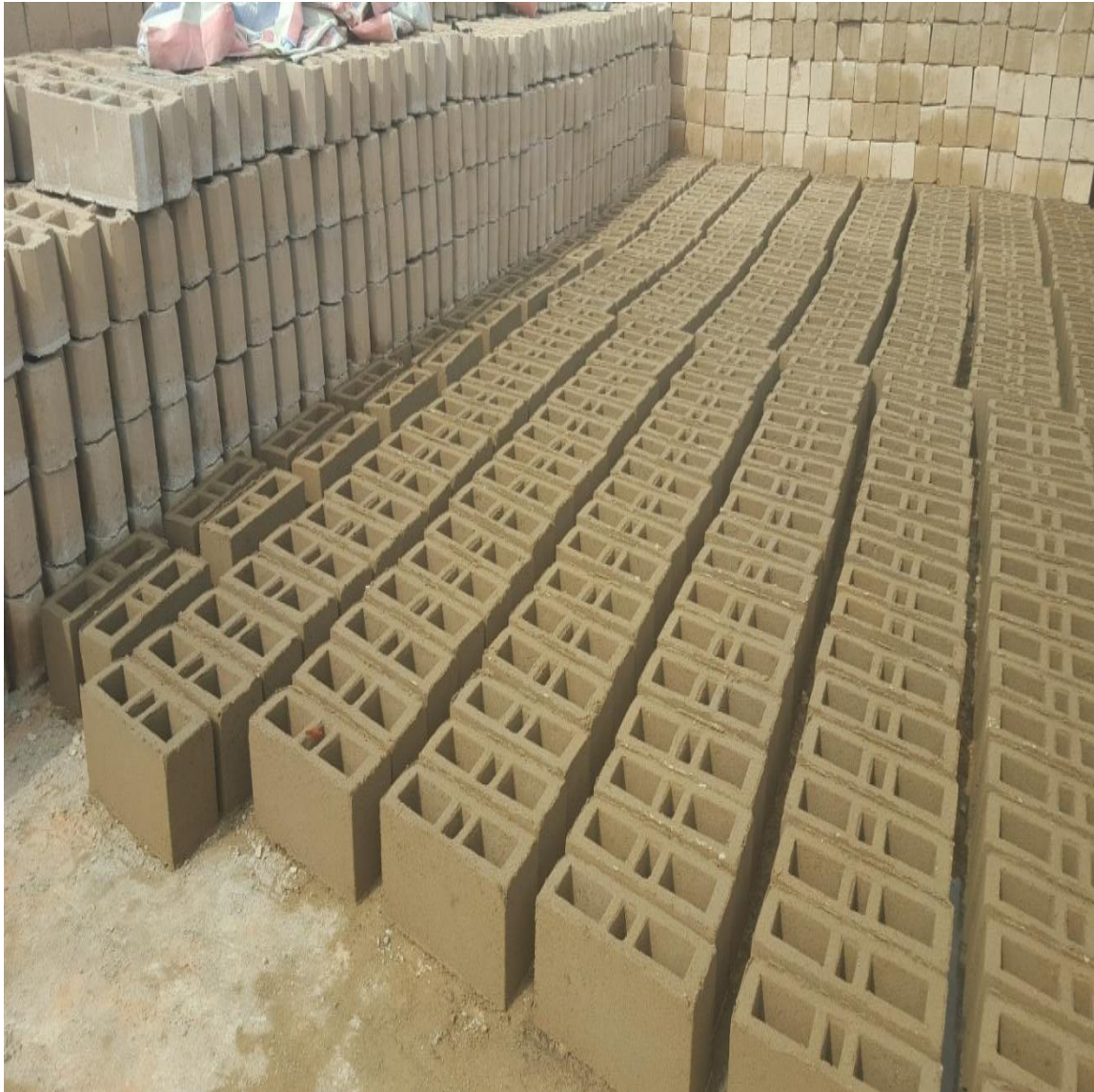
Figure 19 : Confection de l'agflo creux

L'image ci-dessous montre la confection et le stockage des briques. Sur ce chantier la confection des agglos a démarré au moment des réalisations des fouilles de terrassement ; un choix justifié par le conducteur des travaux.