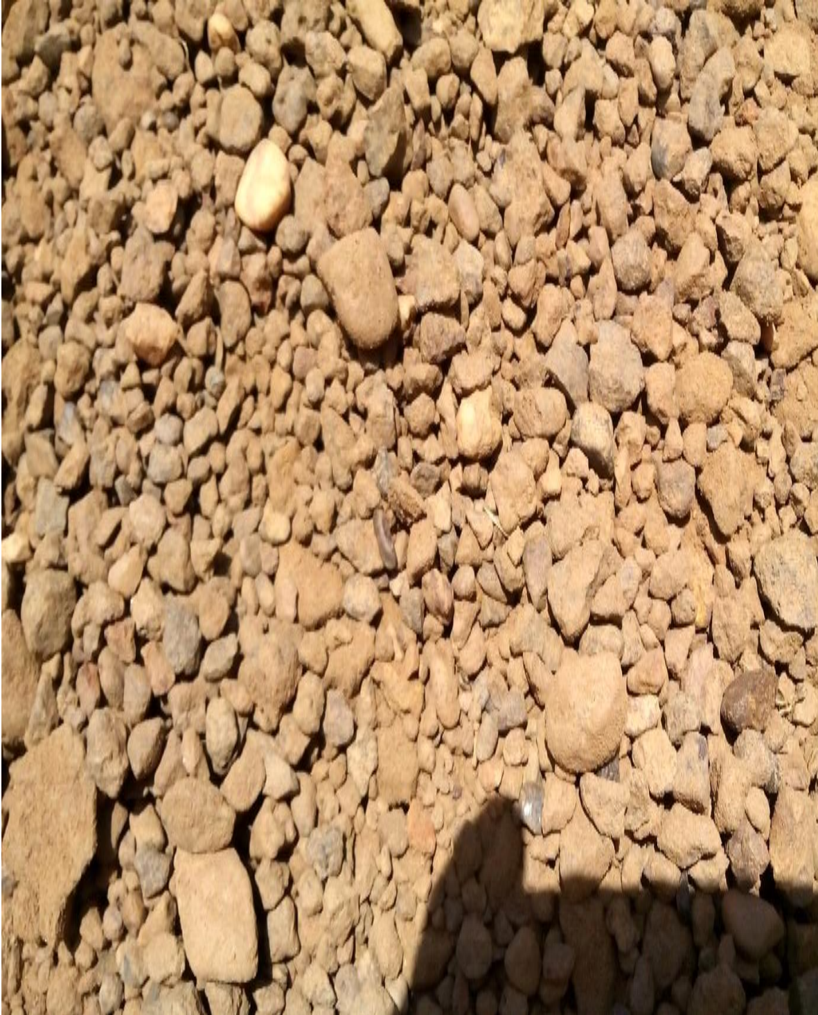
Figure. 2 : Gravier propre