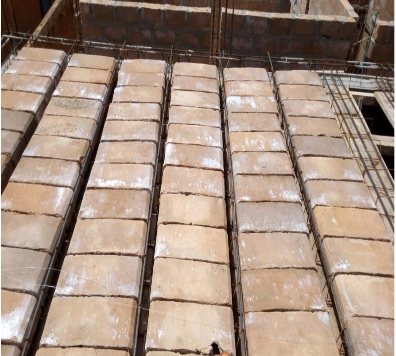
Figure 26 : Pose et calage des entrevous