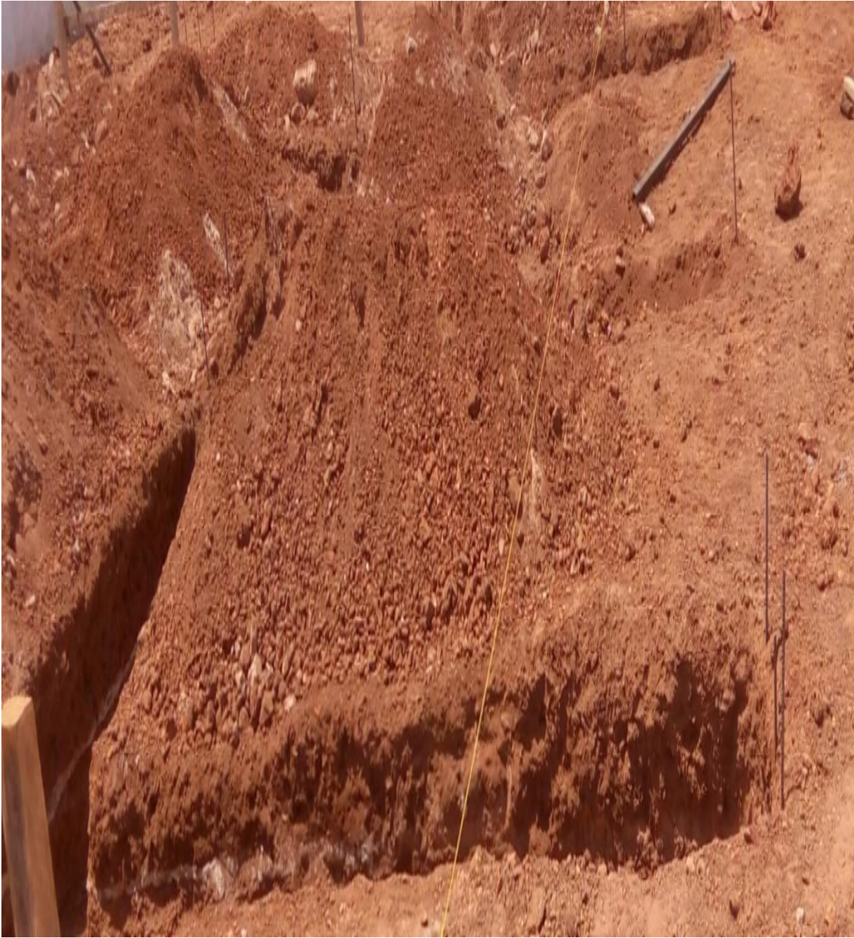
Figure 10: Exécution de la fouille