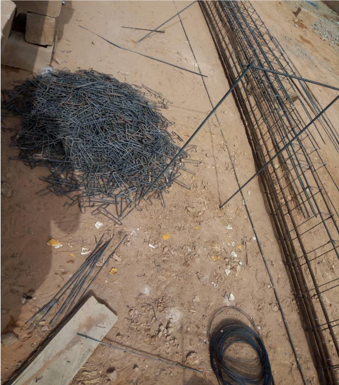
Figure 8 : Façonnage