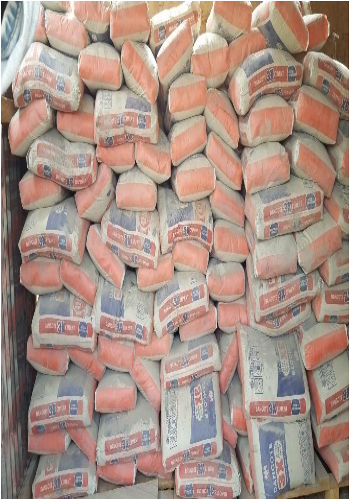
Figure 4 : Aire de stockage ciment