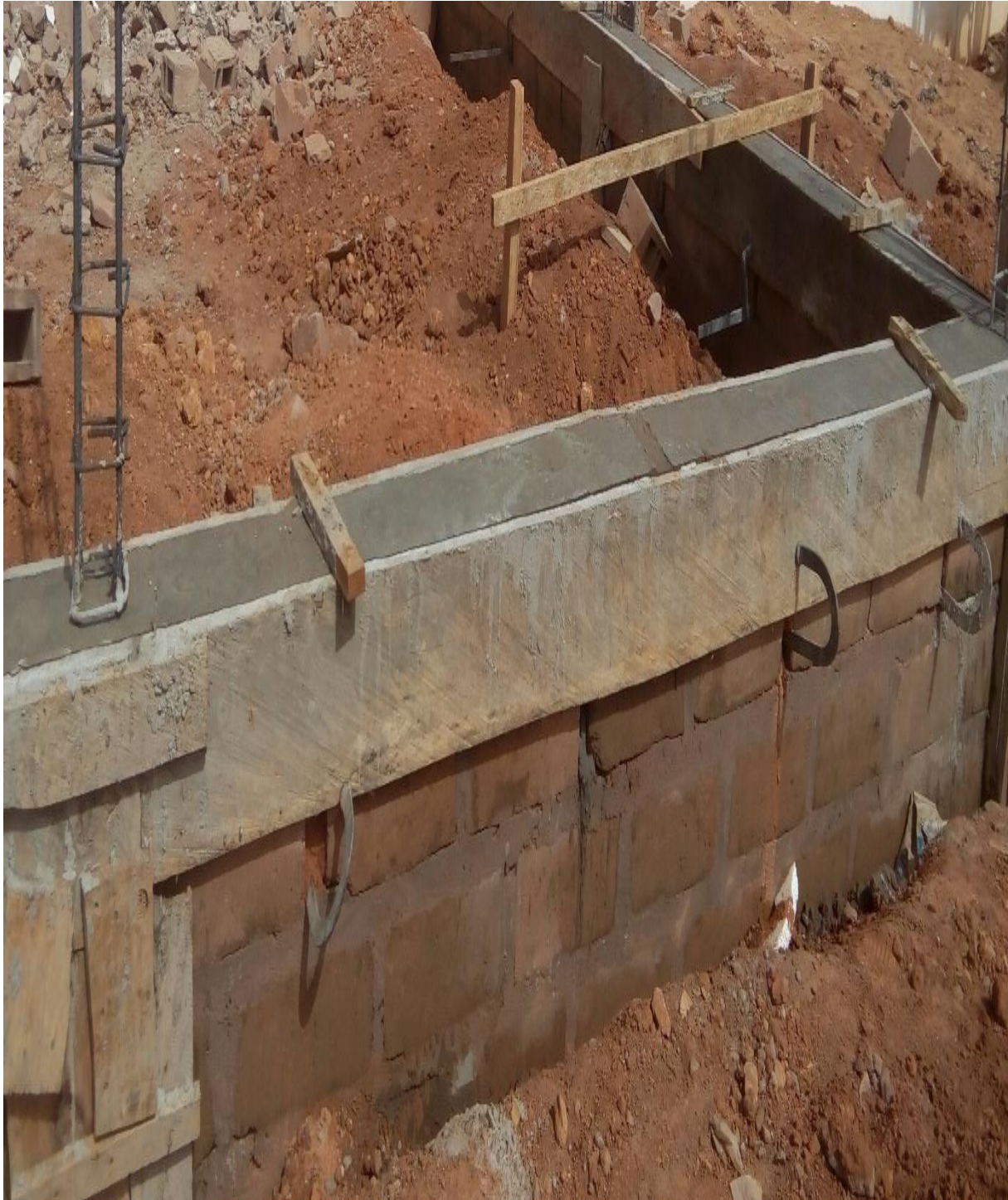
Figure 16: Chainage bas