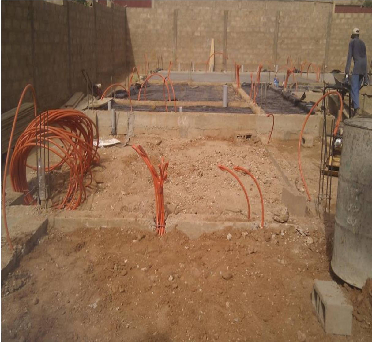
Figure 33: Installation de Plomberie