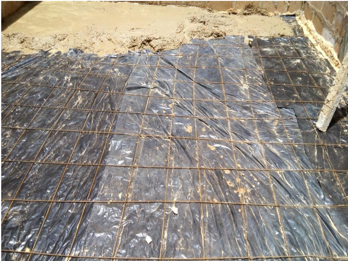
Figure 18:Réalisation du dallage

L'image ci-dessous nous montre l'exécution du dallage