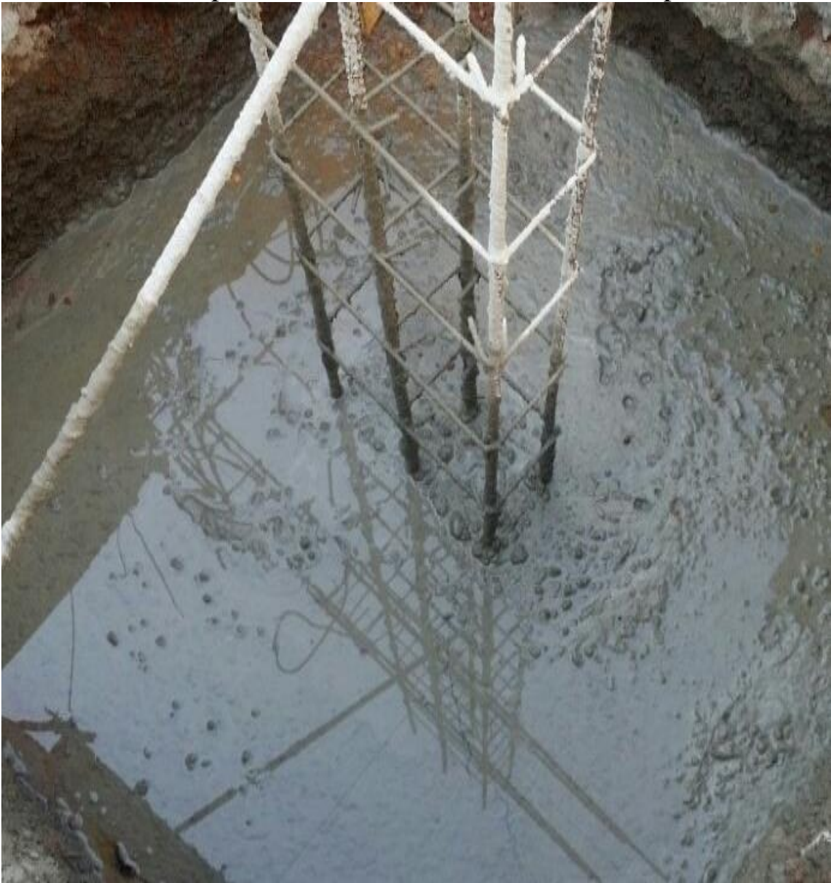
Figure 7 : Poteau pour semelle