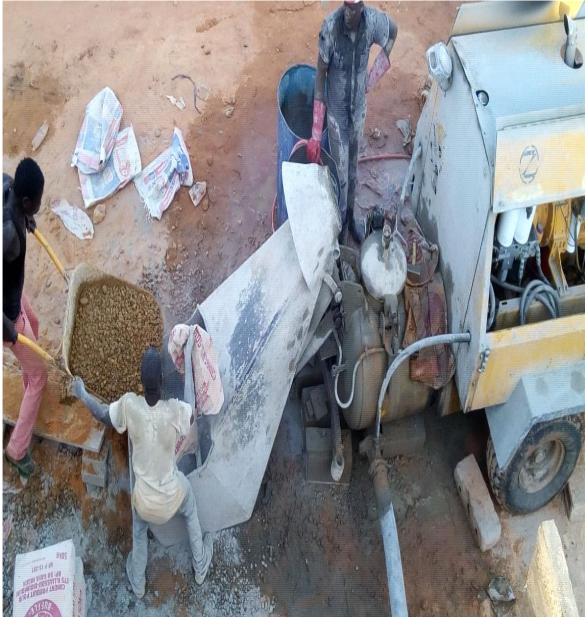
Figure 27 : Fabrication du béton