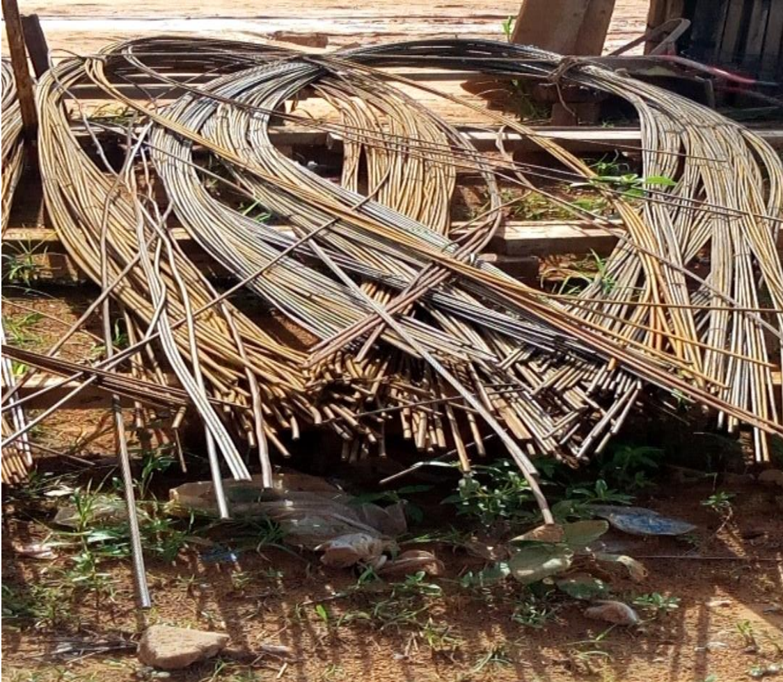
Figure 5 : Aire de stockage des armatures