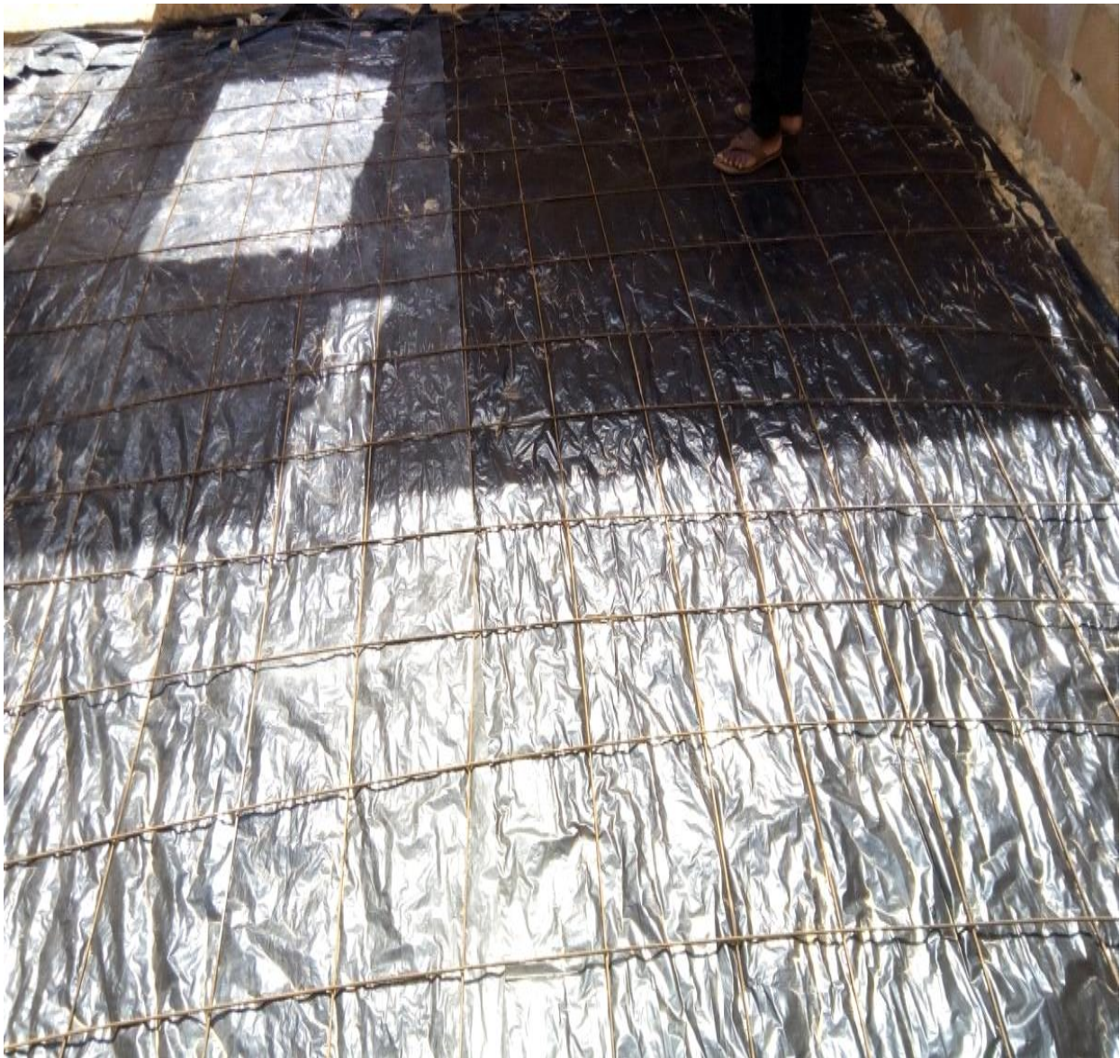
Figure 17 : Pose des armatures

Une étanchéité en film polyane est placée sur le remblai latéritique pour empêcher les retombes d'eau, très plastique c'est-à-dire avoir l'aspect d'une masse cohérente qui coule pas veillé à ce que le dallage soit arrosé deux fois par jour.