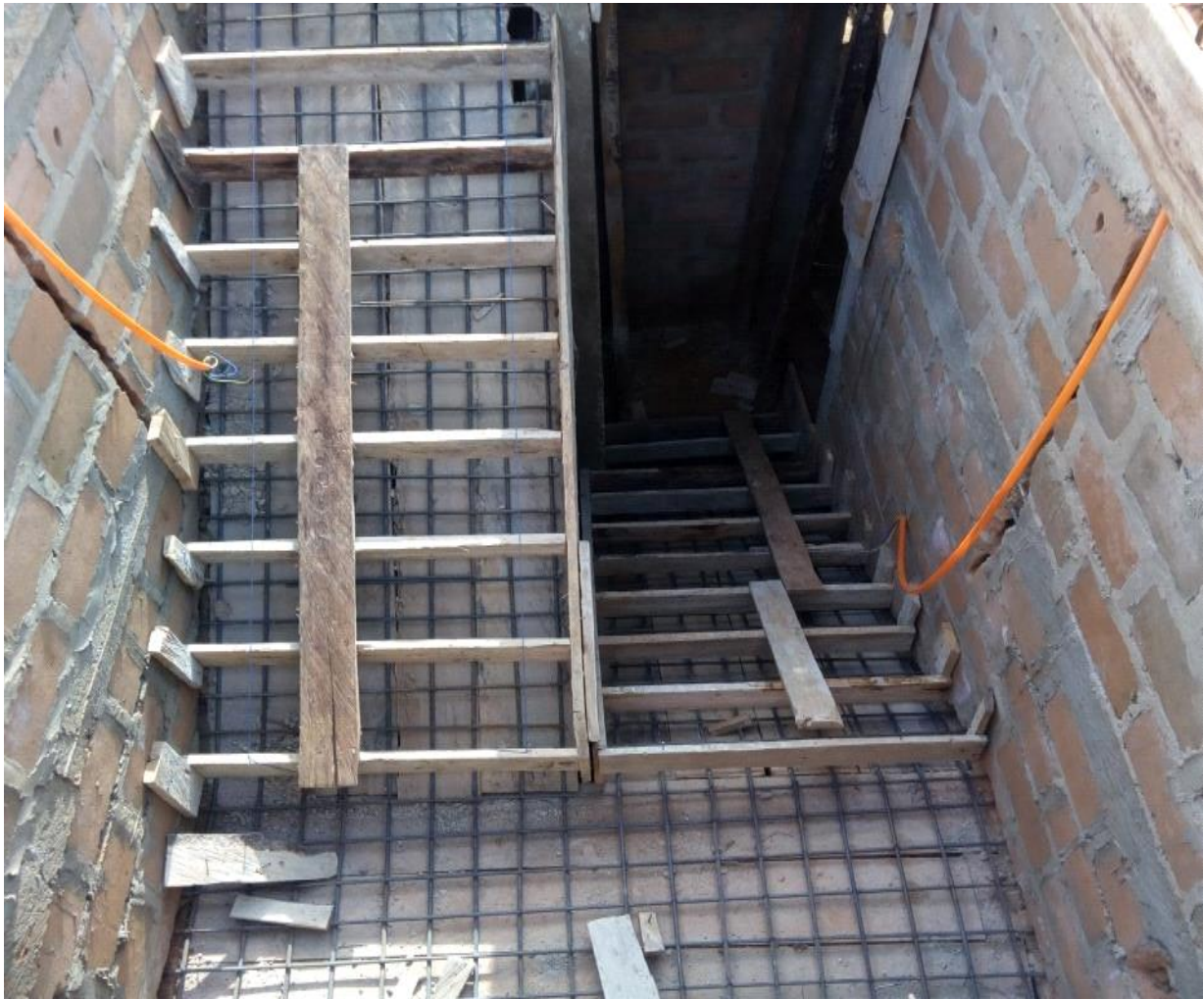
Figure 35 : Coffrage de l'escalier