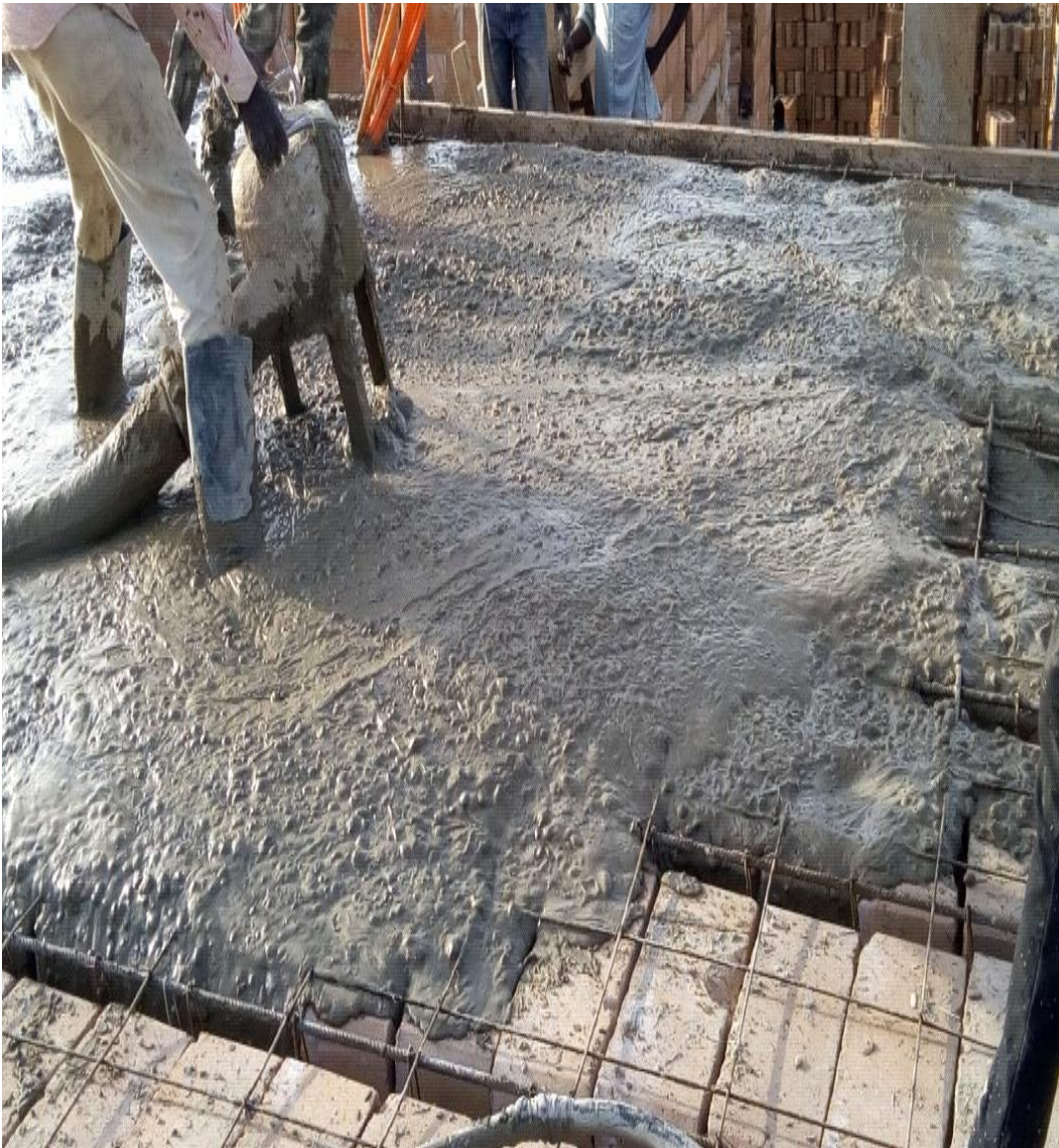
Figure 29 : Coulage du béton et Hourdage des agglos