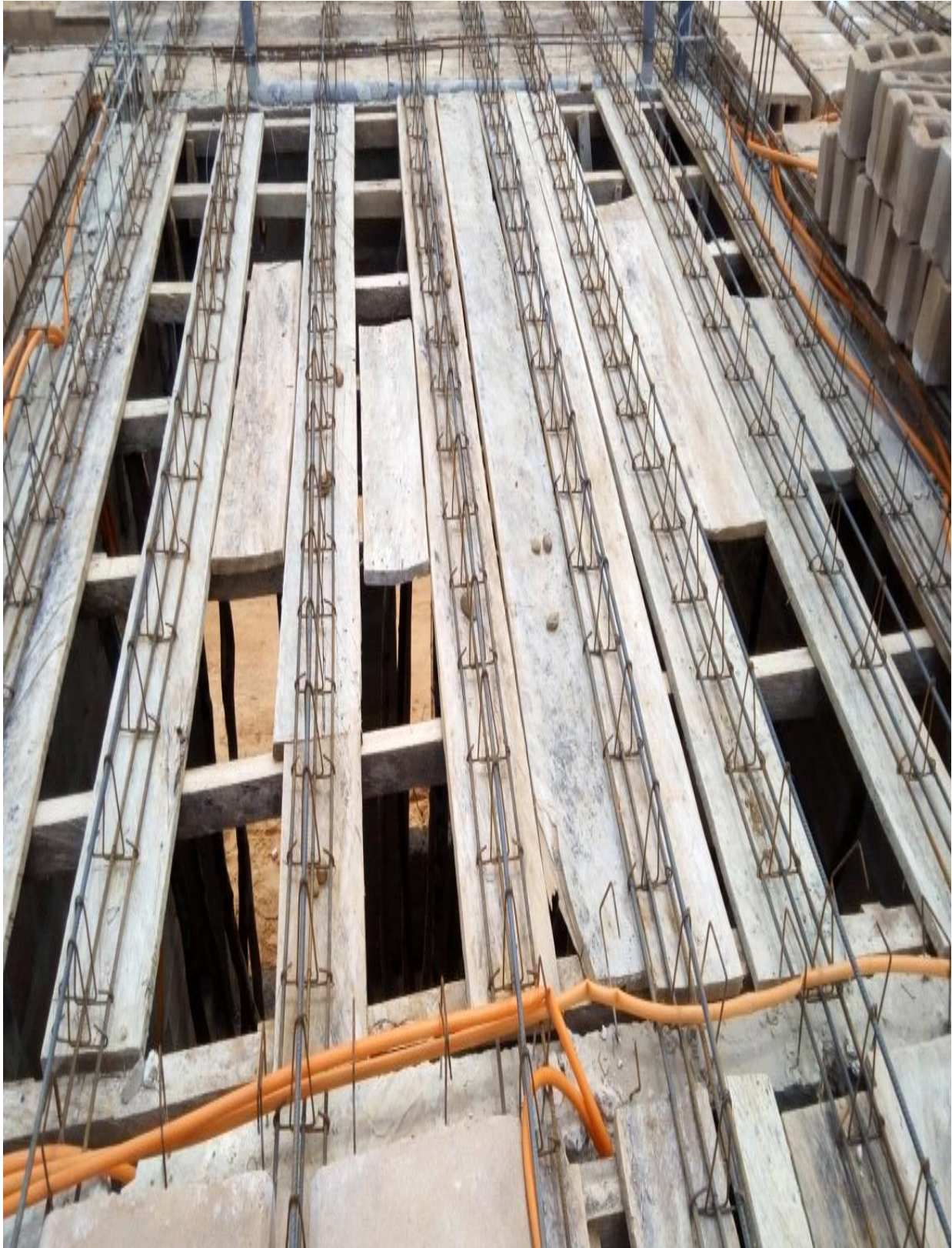
Figure 25 : Pose et calage des nervures