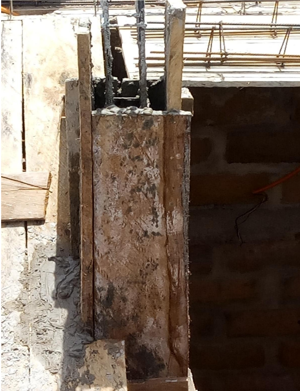
Figure 21: Poteau en Béton Armé