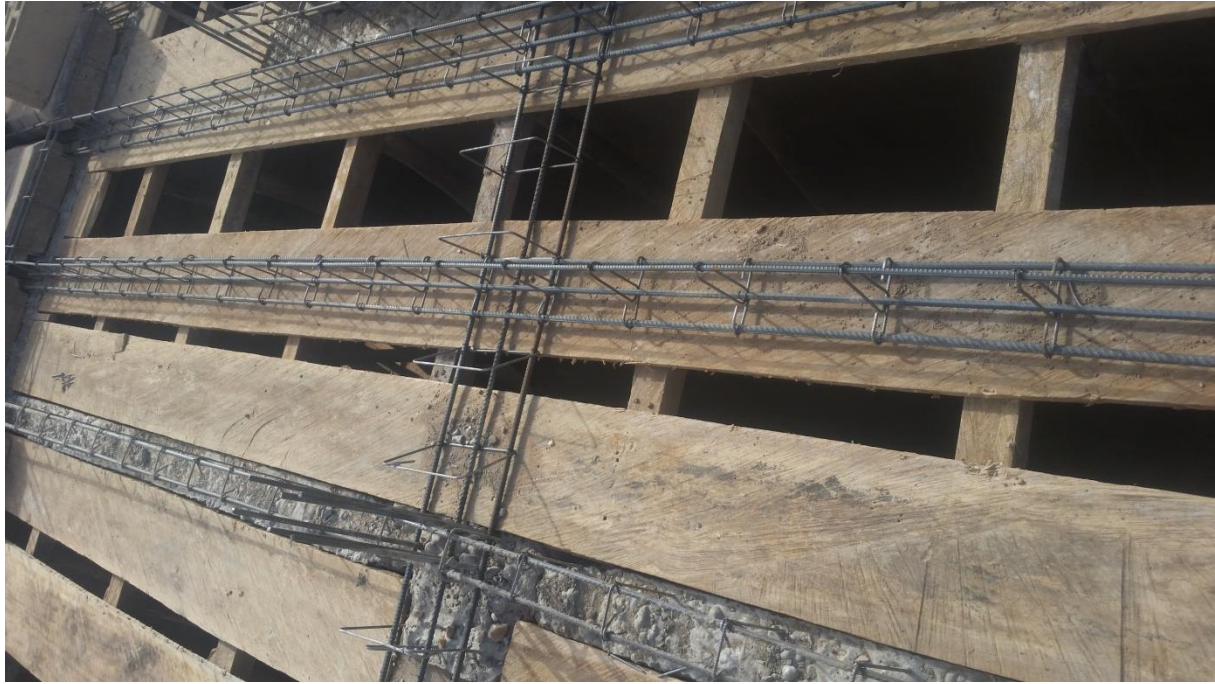
Figure 31 : Mise en place du ferrailage de dalle de compression