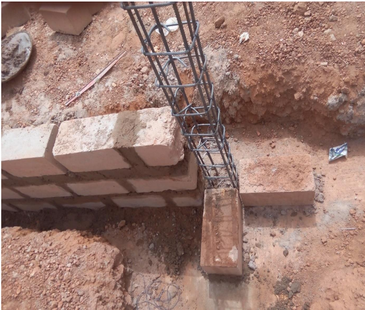
Figure 15: Soubassement

de semelle. La première rangée de pose sur la semelle est centrée pour chaque côté à travers le fil d'axe attaché, et une règle qui à sa partie supérieure sera placée contre le fil d'axe et la partie inférieure étant sur la semelle sera mis à niveau verticalement par le niveau à maçon, ainsi une fois l'axe matérialisé par un tracé après projection verticale, les deux briques d'extrémités sont centrées par rapport à ces tracés. Ensuite toutes les autres briques sont alignées en attachant un file aux faces latérales de ces deux briques, ainsi à chaque rangée on met d'abord à niveau les deux briques d'extrémités à l'aide du niveau à maçon.