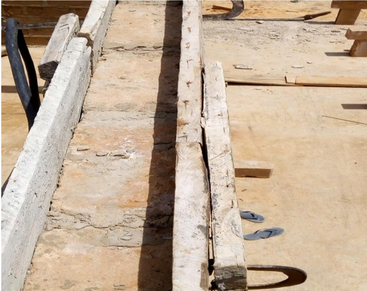
Figure 23 : Coffrage