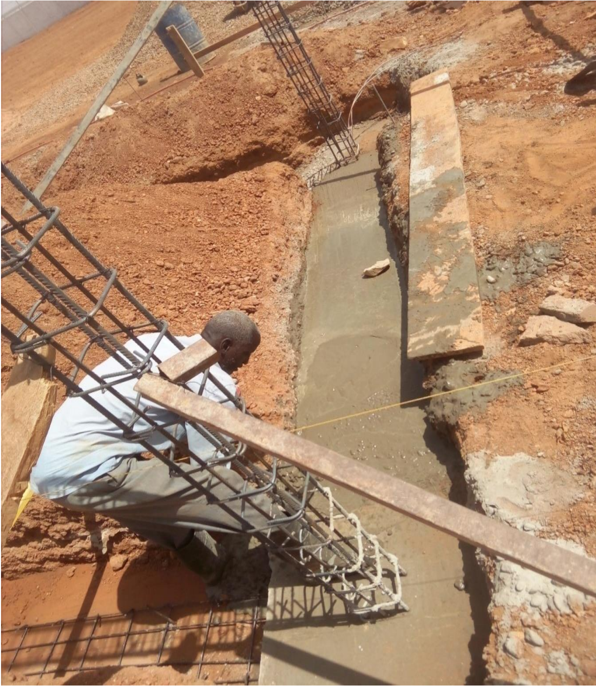
Figure 14: Béton pour semelle