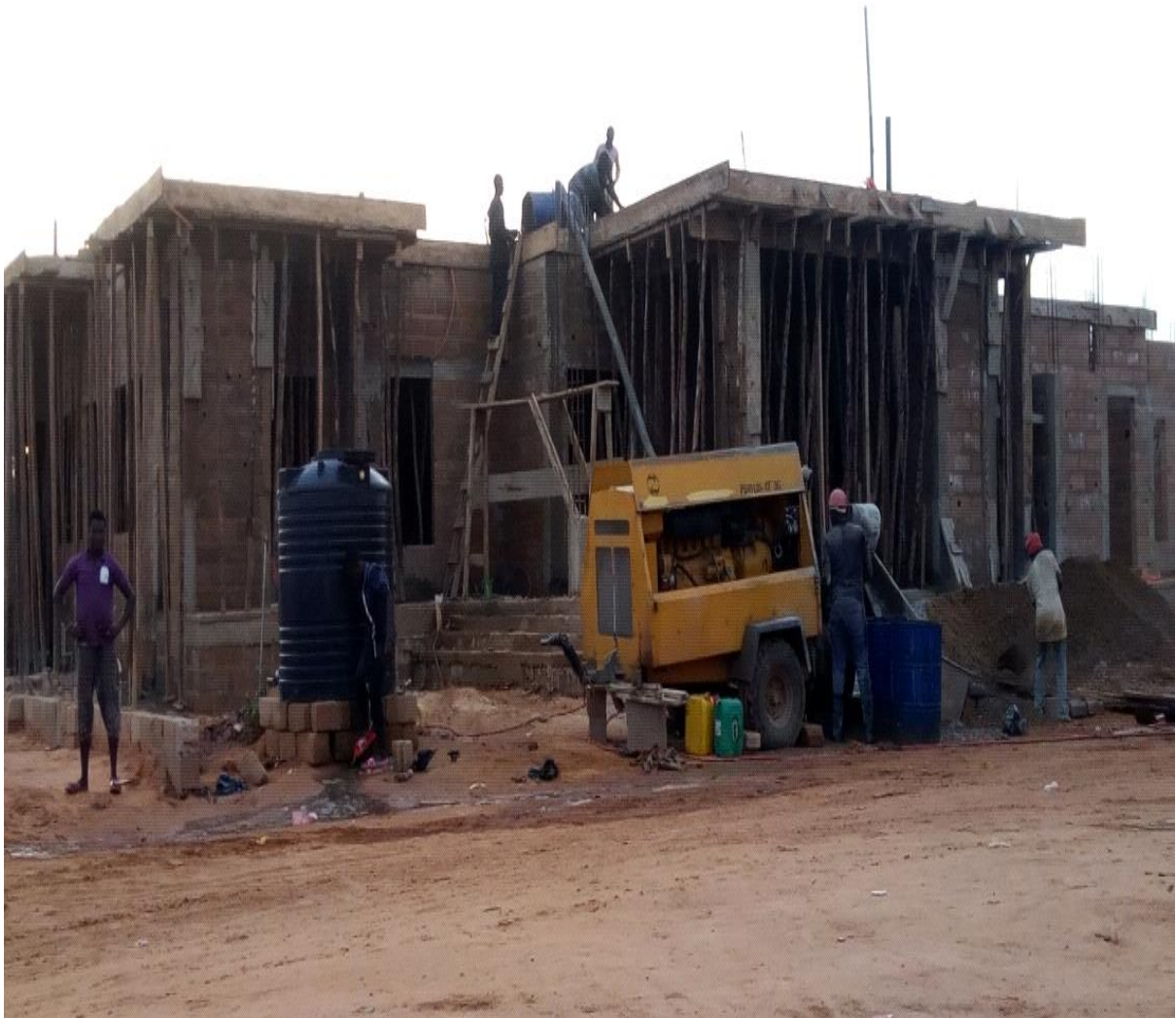
Figure 28 : Transport du béton