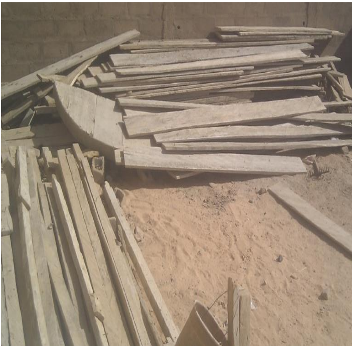
Figure 6 : Aire de stockage des planches