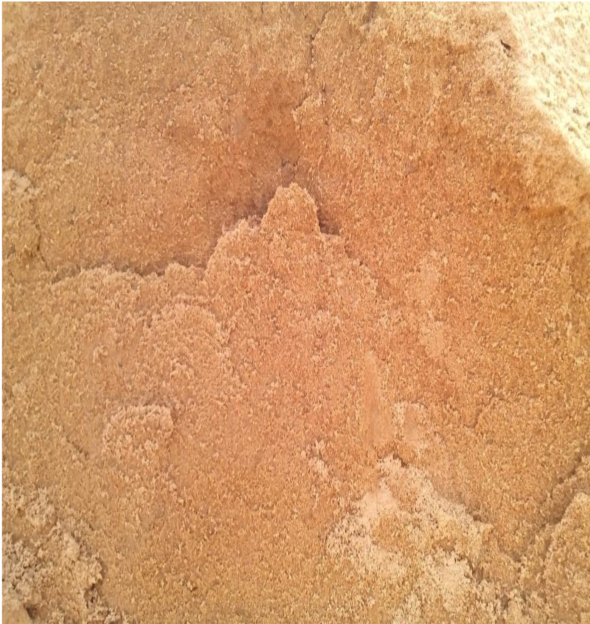
Figure 3: Sable de rivière

vionnaire dépourvu des impuretés car ils sont lessivés pendant leur transport de leurs sources à leur lieu de décantation (rivière, koris ...) ;