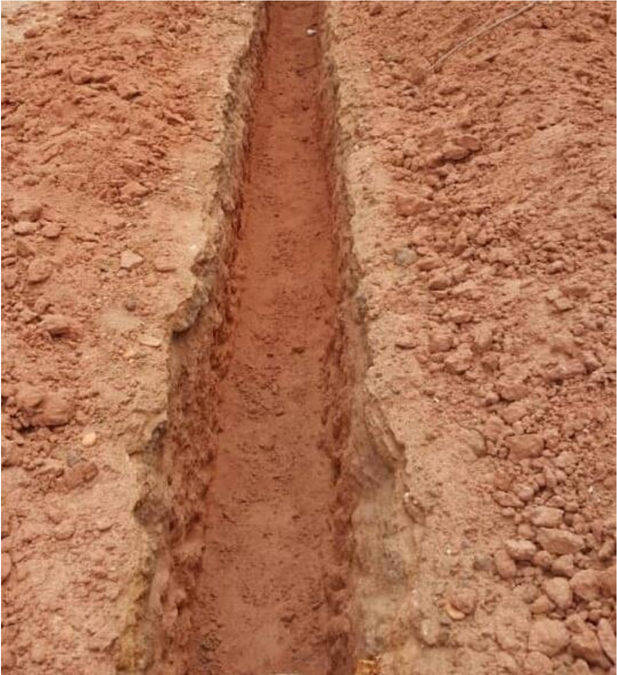
Figure 12_: Exécution de fouille en rigole pour Fondation